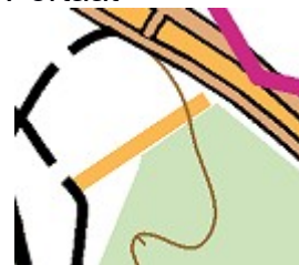
avoin linja, ajokelpoinen

Kartassa käytetään pyöräsuunnistuksen neliportaista uraluokitusta. Koska maasto on hyväkulkuisia eikä pistepolkua ole juurikaan, on pistepolun merkillä merkitty heikkoja polkuja, jotka ovat ajettavissa, mutta erottuvat heikommin.